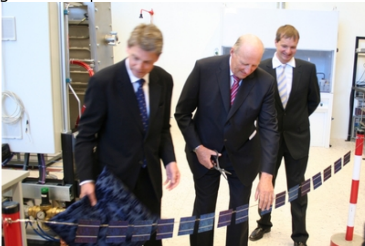
Kong Harald klipper solcellesnora, og erklærer laboratoriet på IFE for åpnet. Dette solcellelaboratoriet er Norges største.

I ettermiddag åpnet Kong Harald solcellelaboratoriet, som det knyttes høye forventninger til. Inne i laboratoriet klippet Kongen over en solid snor som var pyntet med kvadratiske blå solceller, før han fikk en guidet tur på området.